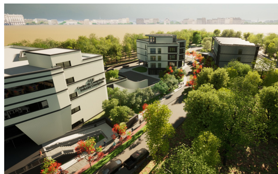
Campusul Dual Integrat "Banatul Montan" (investiție în curs - 2025)