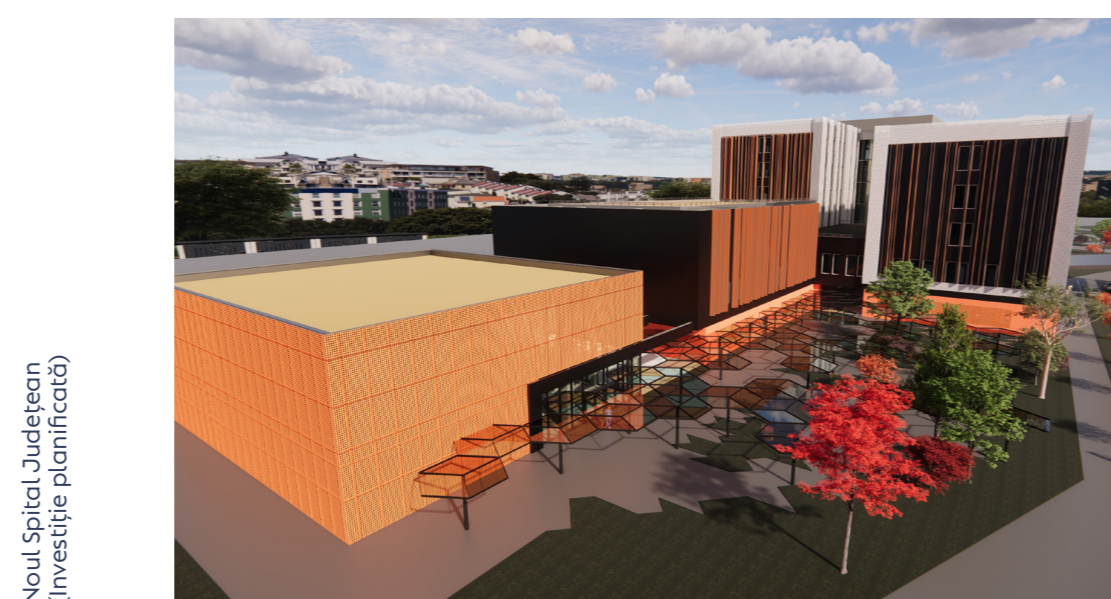
Noul Spital Județean (investiție planificată)